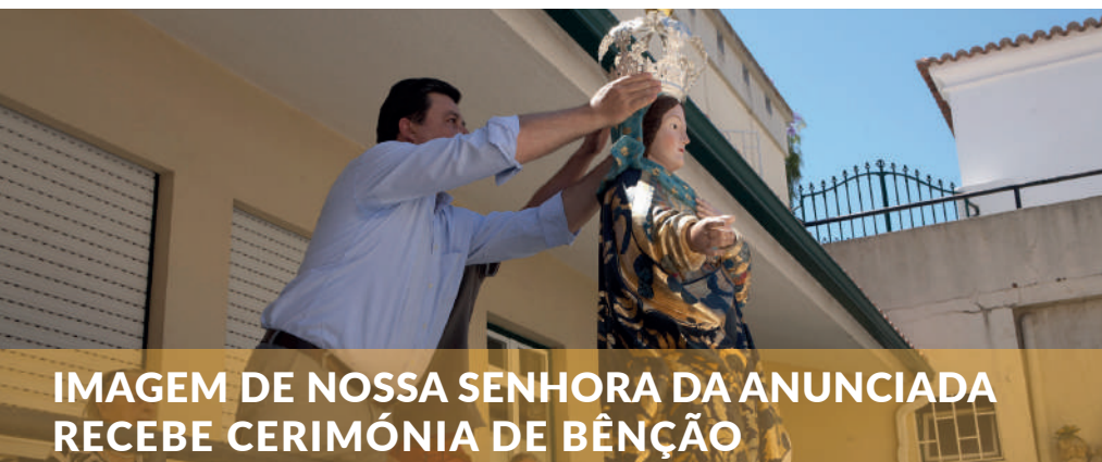
IMAGEM DE NOSSA SENHORA DA ANUNCIADA RECEBE CERIMÓNIA DE BÊNÇÃO